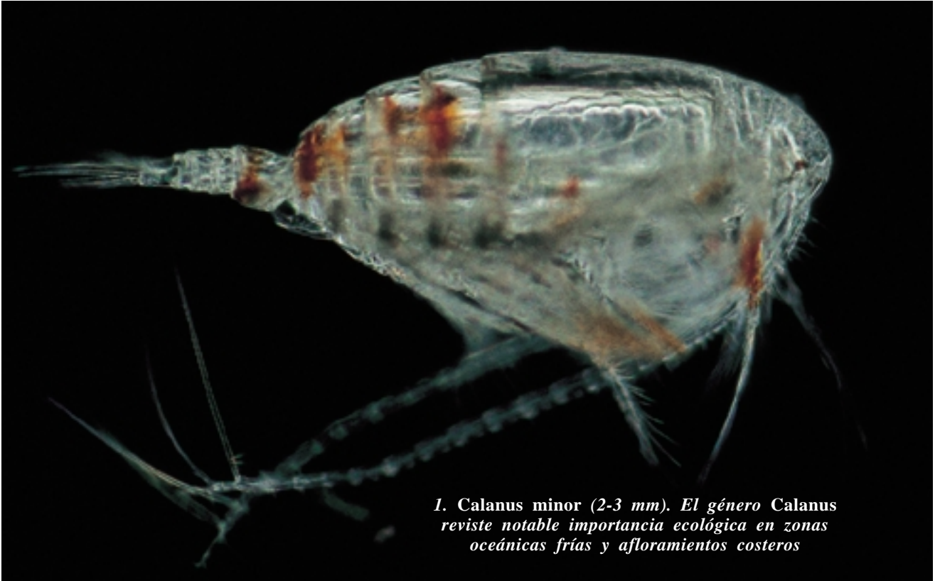
1. Calanus minor (2-3 mm). El género Calanus reviste notable importancia ecológica en zonas oceánicas frías y afloramientos costeros

Los copéodos son, probablemente, los animales pluricelulares más abundantes del planeta. Estos crustáceos de un insignificante milímetro de tamaño superan en número a los mismos insectos, no así en diversidad específica. Son organismos acuáticos, marinos en su mayoría y de distribución cosmopolita. Han colonizado multitud de ambientes, desde las heladas aguas que rodean los casquetes polares hasta los océanos tropicales. Si bien predominan los de vida libre que se alimentan de organismos unicelulares (algas y ciliados), no son pocas las especies depredadoras de otros copéodos, cuando no parásitas de cetáceos, peces, equinodermos, moluscos y anélidos.